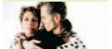
2003: Kari Bremnes.