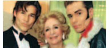
1997: Morten Harket og Wenche Foss.